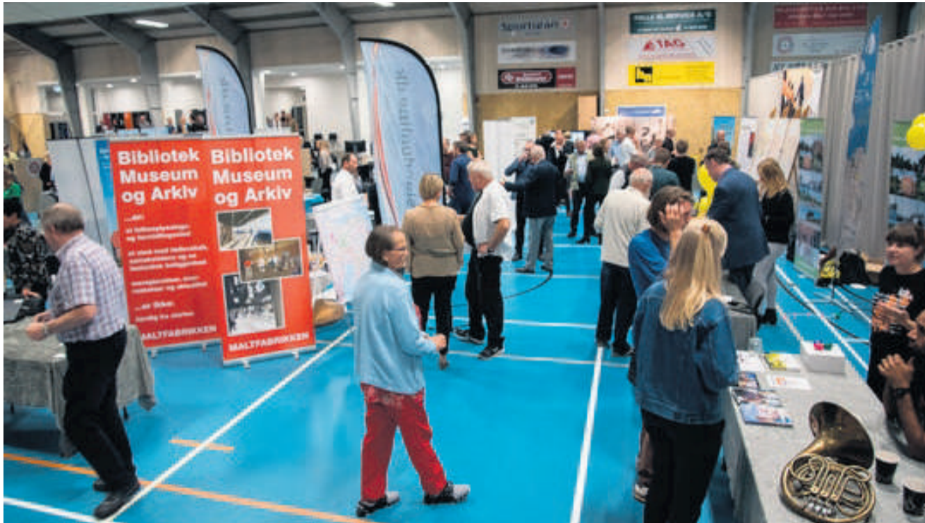
Aftenen indledes med en traditionel budgetgennemgang og ordførerrunde. Pressebillede