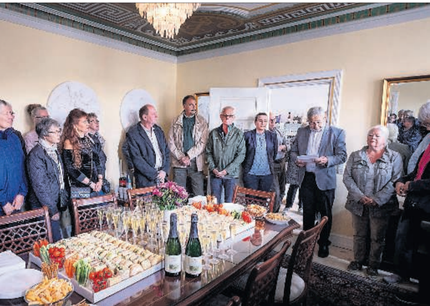
Genindvielsen af rådhuset trak mange nysgerrige til. I ægte bryllupsstil var der naturligvis champagne i glassene.