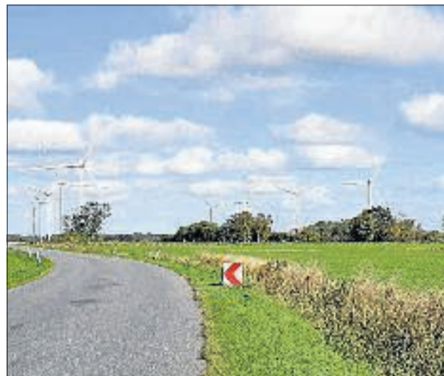
Sådan vil de nye vindmøller i Veddum tage sig ud, set fra Nørrevangsvej. Visualisering: Orbicon