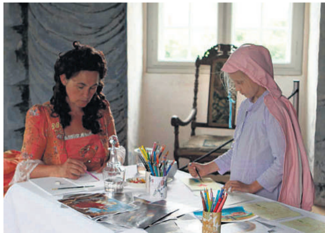
Herregårdsmuseet Gammel Estrup ved Auning har i påsken fokus på dels 1700-tallets håndværk og dels på en æggejagt efter museets portrætmalerier.