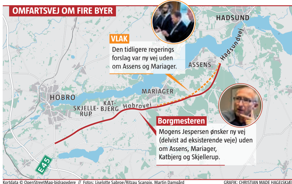
Kortdata © OpenStreetMap-bidragydere GRAFIK: CHRISTIAN MADE HAGELSKJER

den vestlige og østlige del af kommunen bedre.