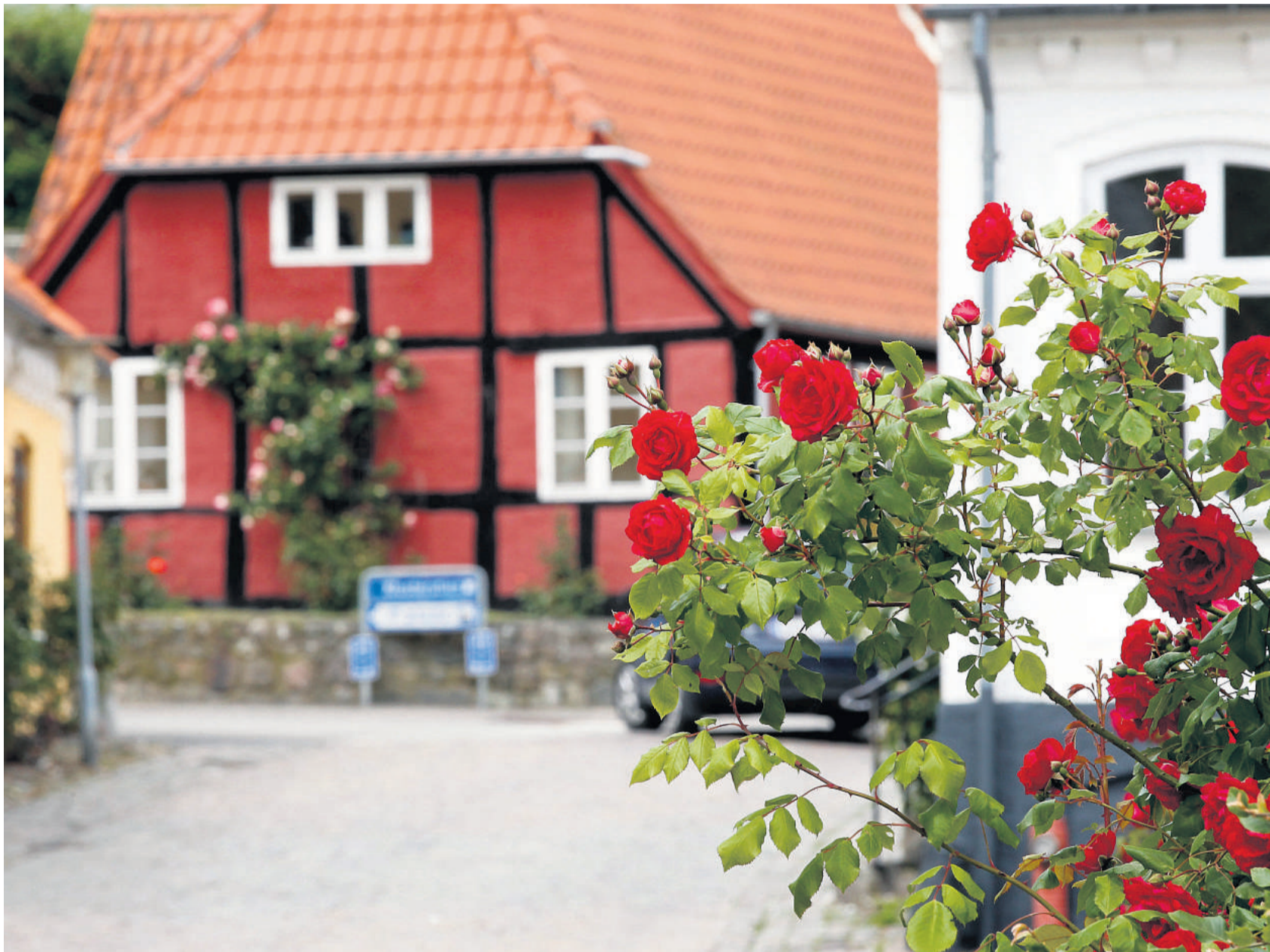
Citta Slow ser gerne brandet "Rosernes By" anvendt endnu mere. Arkivfoto

Hendes introduktion til emnet var samtidig oplæg til seks arbejdsgrupper, der under årsmødet så småt tog