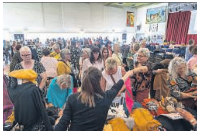
De 150 billetter til kvindedagen var igen i år revet væk.

- Sidste år var vi to mænd. Men ham den anden var vist hevet med af konen, konsta-