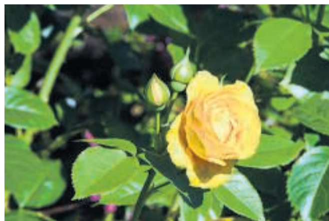
Liv i købstaden: Rosenhaven i Mariager.

kan nyde en bog, mens næsen kildres af skønne dufte.