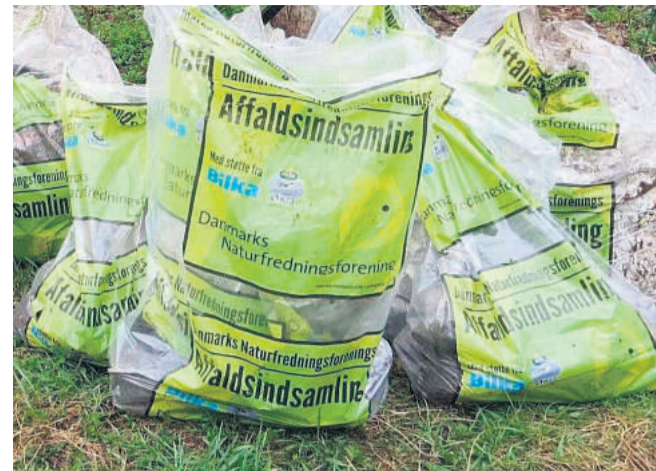
I Assens skal hele byen gøres fin til foråret.