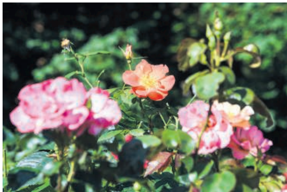
Liv i købstaden: Rosenhaven i Mariager.