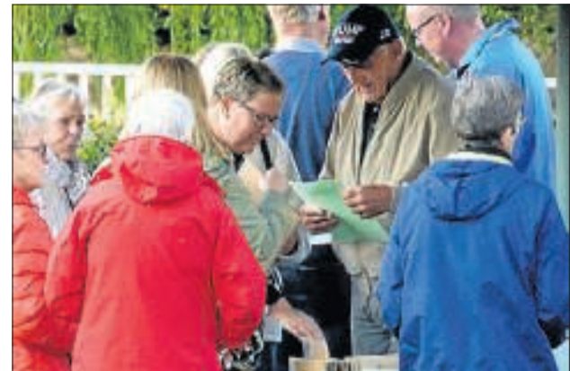
Bankopladerne bliver studeret, inden man sendes ud på ruten.