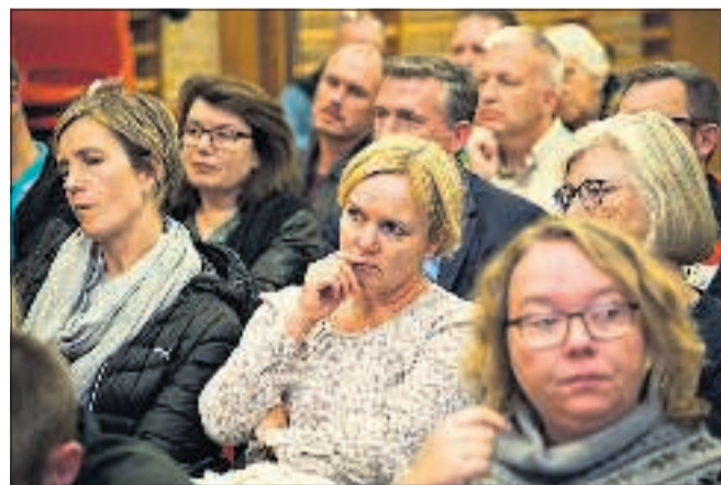
Hvordan skal Mariager tiltrække flere børnefamilier? Spørgsmålet blev debatteret i byen, der er ramt af faldende børnetal, og svaret er ikke så enkelt endda.