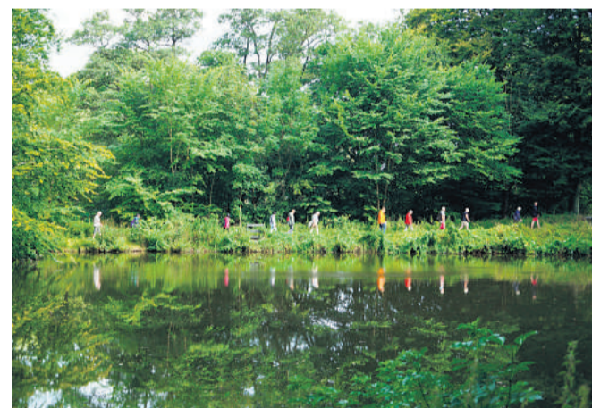
"Vand" er temaet for dette års bededags-vandring.

Alle er hjertelig velkomne til en interessant og informativ vandring gennem det smukke anlæg, lyder det fra Birgittaforeningen i Mariager.