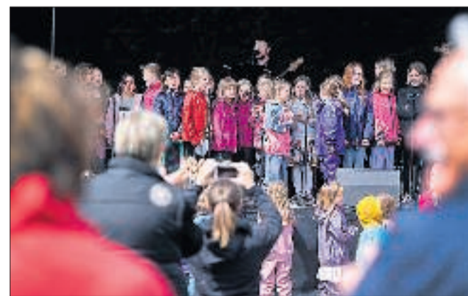
I år kunne Funky Festival fejre 10 år med fest for SFO-børn i Mariagerfjord. Alle SFO'er sørgede for et eller flere musikalske indslag.

eller flere musikalske indslag, og der var både gruppe- og soloptrædere på scenen, hvor et fem mand stort liveband stod klar til at akkompagnere. De unge sangstjerner optrådte med