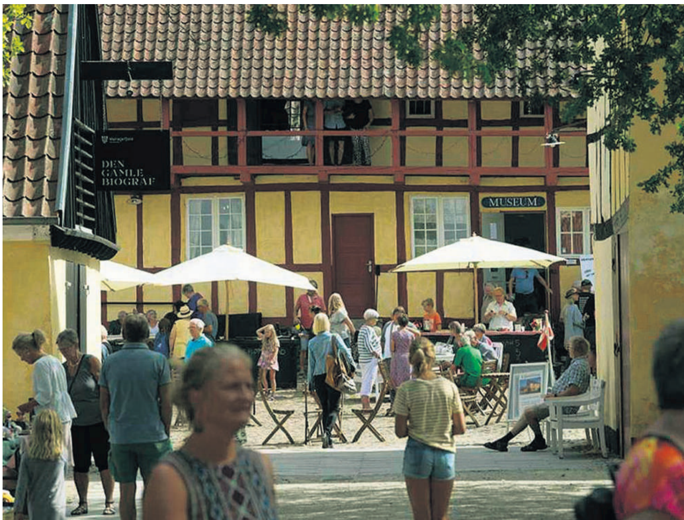
Mariager har et stærkt brand og er kendt for hyggelige og velbesøgte arrangementer, hvilket glæder de aktive i byens Citta Slow-organisation.

Efterfølgende holder Citta Slow sin ordinære general-