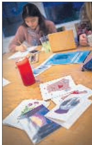
Kirkepladsens Blomster og boghandlen i Mariager har købt 80 af de håndlavede kort. I alt har pigerne lavet otte forskellige motiver, der hver er trykt i 100 eksemplarer.

- Jeg ville gerne lave noget i min fritid, men jeg havde ikke fundet det rigtige. Hvis