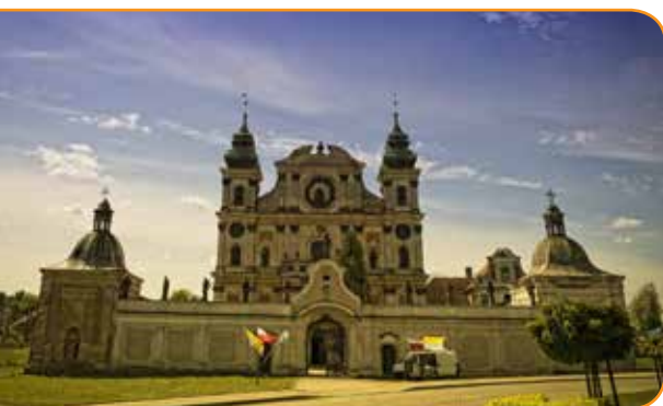
Sanktuarium Nawiedzenia Najświętszej Maryi Panny i św. Józefa w Krośnie położone w pobliżu trasy

Część tego najdłuższego szlaku rowerowego w Polsce przebiega przez województwo warmińsko-mazurskie (ok. 395 km) i umożliwia zwiedzanie jego północnych terenów, bardzo malowniczych oraz obfitujących w atrakcje przyrodnicze i kulturowe. W regionie wydzielono trzy odcinki szlaku, nazwane królestwami rowerowymi: „Nad Zalewem Wiślanym” (93 km), „Warmia i okolice” (147 km) i „Północne Mazury” (153 km). Trasa wiedzie m.in. przez miasta należące do Cittaslow: Górowo Iławeckie, Lidzbarsk Warmiński, Bartoszyce, Sępólno („Warmia i okolice”), Gołdap („Północne Mazury”). Kolejne etapy pokonywania Green Velo można urozmaicać wycieczkami po licznych trasach lokalnych. Jadący szlakiem mogą korzystać z Miejsc Obsługi Rowerzystów, wyposażonych w stojaki, ławy, stoły, wiaty, kosze na śmieci i tablice informacyjne. Na turystów czekają również Miejsca Przyjazne Rowerzystom, czyli rekomendowane obiekty (noclegowe, gastronomiczne, usługowe), które dostosowują swoją ofertę do potrzeb miłośników dwóch kółek.