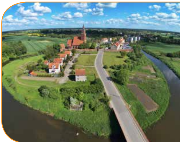
Sępól w zakolu Łyny, fot. Robert Zakrzewski

Główna rzeka regionu to atrakcyjny szlak kajakowy (196 km). Od Dobrego Miasta wiedzie on m.in. przez Smolajny i Łaniewo do Lidzbarka Warmińskiego. Tu do Łyny dopływa Symsarna, którą również warto przebyć kajakiem. Dalej Łyna płynie przez Rogóz i Perkujki do Bartoszyce, a potem przez Szylinę Wielką do Sępola, gdzie wpada do niej Guber. W każdej z wymienionych miejscowości jest stacja wodna (w Lidzbarku Warmińskim nawet dwie), umożliwiającą wygodne rozpoczęcie lub zakończenie spływu. Ostatnia ze stanic mieści się w Stopkach, z których do miejsca przecięcia przez rzekę granicy z Rosją jest ok. 5 km. W dolnym biegu Łyny meandrujący nurt jest szeroki i spokojny. Głównym utrudnieniem dla kajakarzy jest kilka elektrowni wodnych, które wymuszają przenoski.