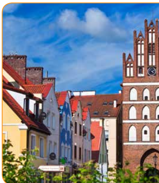
Kamieniczki staromiejskie i Brama Lidzbarska w Bartoszycach