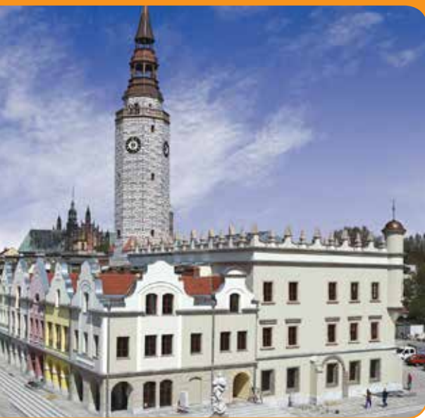
☉ fot. Andrzej Drzazga