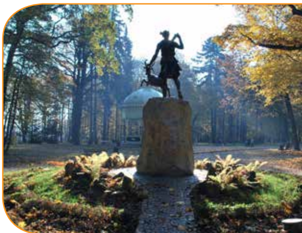
Park Miejski w Prudniku, fot. archiwum Urzędu Miejskiego w Prudniku

Infrastruktura rowerowa Gór Opawskich umożliwiła organizację imprez dla amatorów i profesjonalistów. Najbardziej znana to Memoriał im. Stanisława Szozdy, który co dwa lata ma rangę eliminacji Mistrzostw Polski w Kryterium Ulicznym.