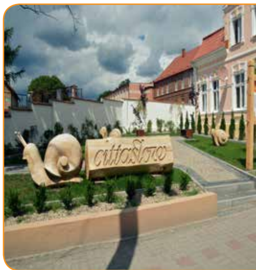
Skwerek Cittaslow w Lidzbarku

Na kolejnych stronach niniejszej publikacji przybliżamy wybrane atrakcje każdego z miasteczek, proponując kilka wycieczek, które pozwolą poczuć ich charakterystyczny klimat. Bieżące informacje o tym, co dzieje się w każdej z miejscowości, można znaleźć na www.cittaslowpolska.pl .