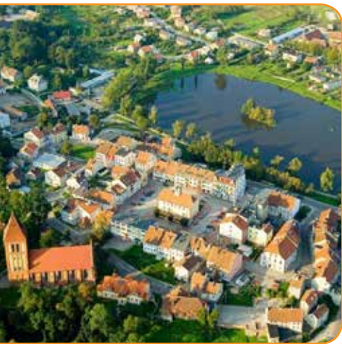
Górowo Iławeckie – miasto na szlaku Green Velo