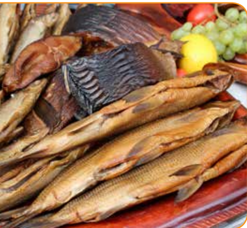
fot. archiwum UMWWM w Olsztynie