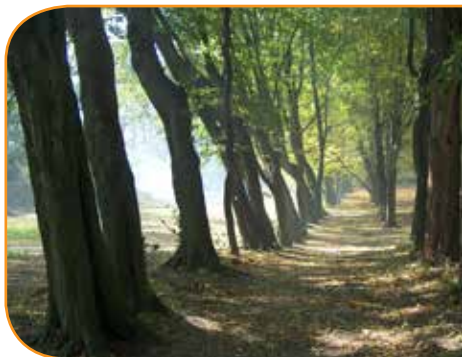
fol. archiwum Urzędu Miasta Rejowiec Fabryczny

Najciekawsze obiekty obu szlaków to: Wieża Ariańska w Krynicy (być może grobowiec Orzechowskiego), ruiny zamku i dworek w Krupem, zabytki i Muzeum Regionalne w Krasnymstawie.